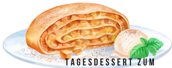
TAGESDESSERT ZUM MENÜ + € 3,50